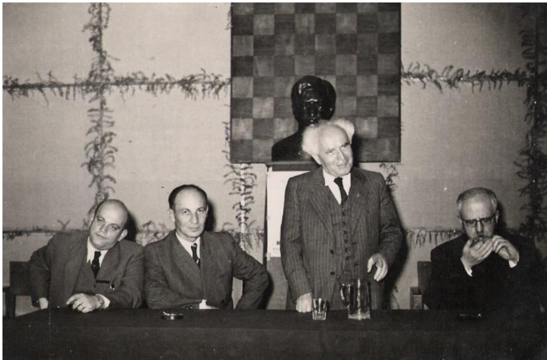
דוד בן-גוריון מברך בטקס הסיום של אליפות ישראל בשחמט 1951

האליפות הראשונה הייתה בחסות ראש הממשלה דוד בן גוריון ז"ל, שאף ברך בטקס הסיום של האליפות: "אין המקריות שלטת בהאבקות המתגוששים בו, ורק ראיית הנולד, כוח ההמצאה וחריפות השכל, קובעים בו את התוצאה".